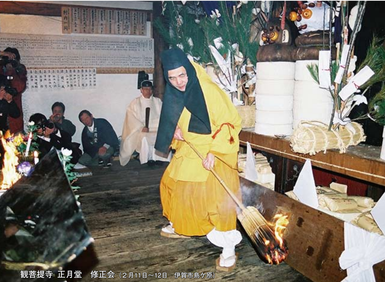
観菩提寺 正月堂 修正会 (2月11日~12日 伊賀市島ヶ原)