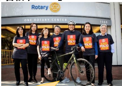
エバンストン事務局Global Communications部アジアチーム。日・韓・台を中心にアジア地域のコミュニケーションを担当。シカゴにお越しの際はぜひお立ち寄りください。

今月、ジョン・ヒューゴ事務総長と6名のスタッフ、ポリオ根絶活動への支援を高めるために約164kmの自転車レースに出場します。