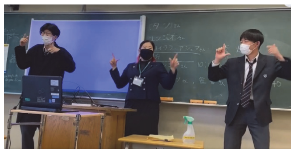
学友と一緒に K-POP グループのダンスを踊る高校生

してこの経験を各自母国に持ち帰って、広めてほしい」と、話しました。また、同クラブは 11 月 20 日にも、都立成瀬高等学校でオンライン交流授業を実施しています。