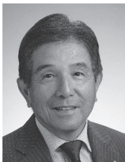
2022-23年度 RI第2630地区ガバナー