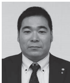
国際ロータリー第2630地区 ロータリーの友 地区代表委員