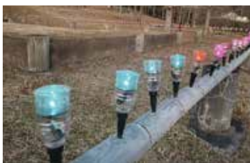
ペットボトルでのライトアップ