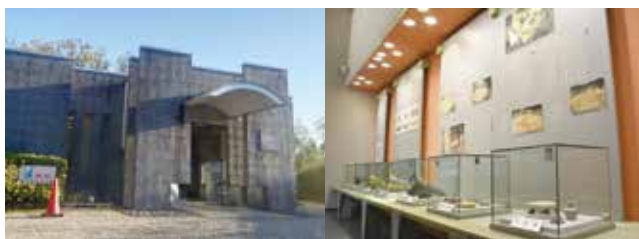
夏見廃寺展示館外観（左）と内観